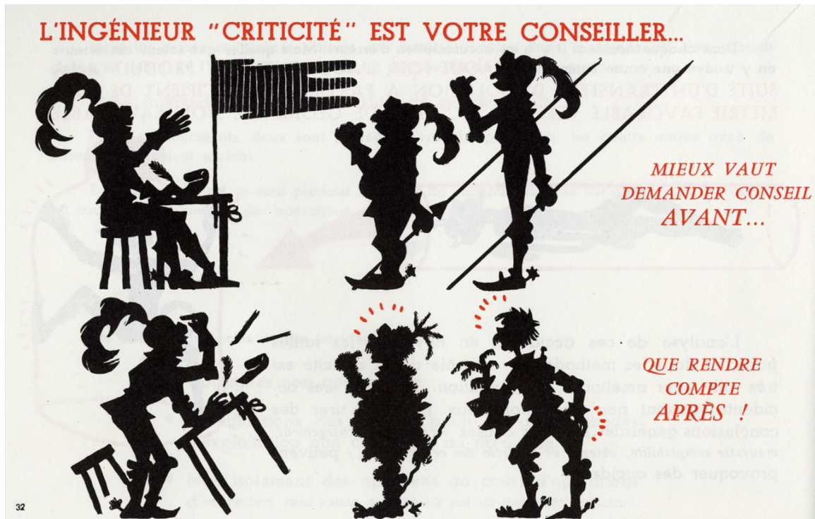
Figure 2. Le recours à l’imaginaire médiéval pour évoquer le risque de criticité. Plaquette «La criticité» (1967). VRH-2014-04-121.