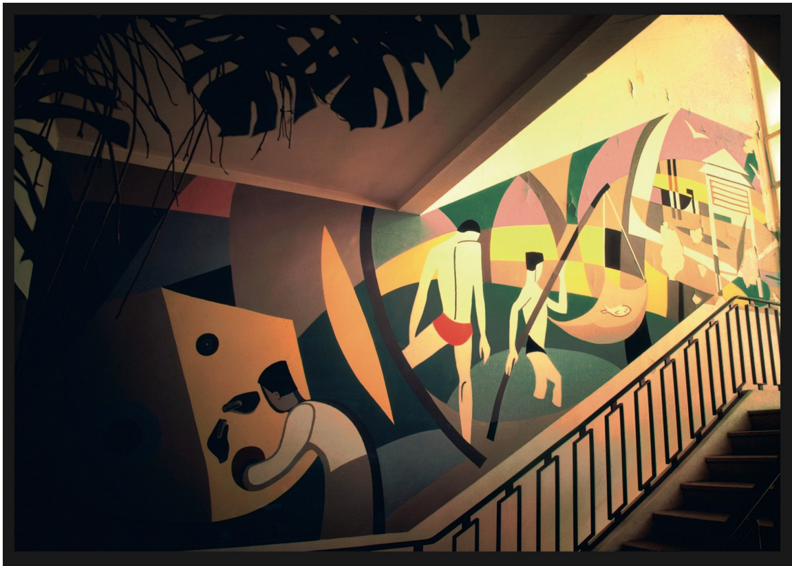
Figure 3. La peinture renvoie aux recherches des avant-gardes modernes de la première moitié du XX e siècle. Castan s’inspire ici de Matisse et des Delaunay pour composer une peinture spectaculaire, exaltant la prouesse technique et la douceur de vivre méridionale. Fresque du SPR (1962). CEA / J. CASTAN.