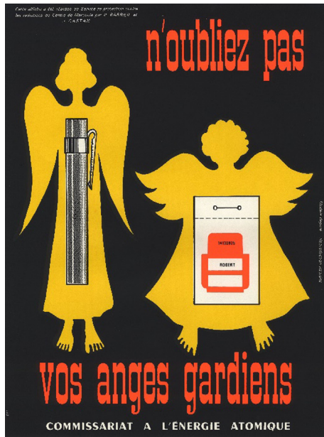
Figure 1. Le stylo et le film dosimètres sont des créatures célestes protégeant la vie des travailleurs. Ils constituent aussi un couple inséparable, comme Laurel et Hardy. Affiche préventive (1959). VRH 2014-04-09.