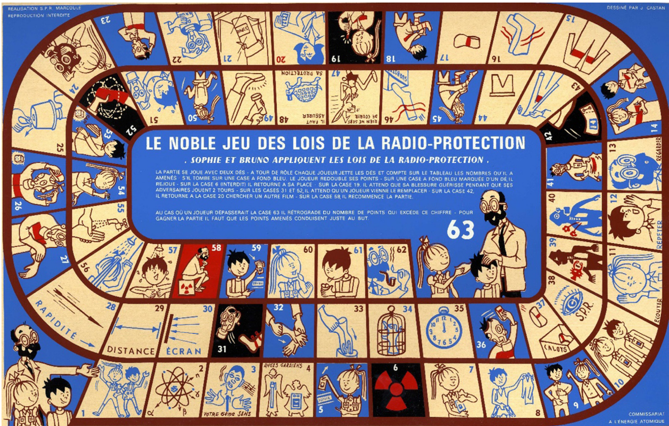
Figure 5. Un objet médiateur entre les travailleurs et leur famille : « Le noble jeu des Lois de la Radioprotection » (1966). VRH 2014-04-120.

futuristes, témoignant du rayonnement de la France. Elle montre que la physique nucléaire ouvre de nouveaux horizons techniques, en prenant soin d'exposer les moyens développés pour protéger les travailleurs et l'environnement des radiations.