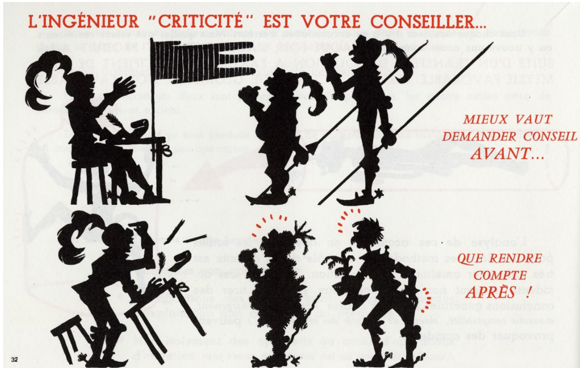
Figure 2. Le recours à l’imaginaire médiéval pour évoquer le risque de criticité. Plaquette «La criticité» (1967). VRH-2014-04-121.