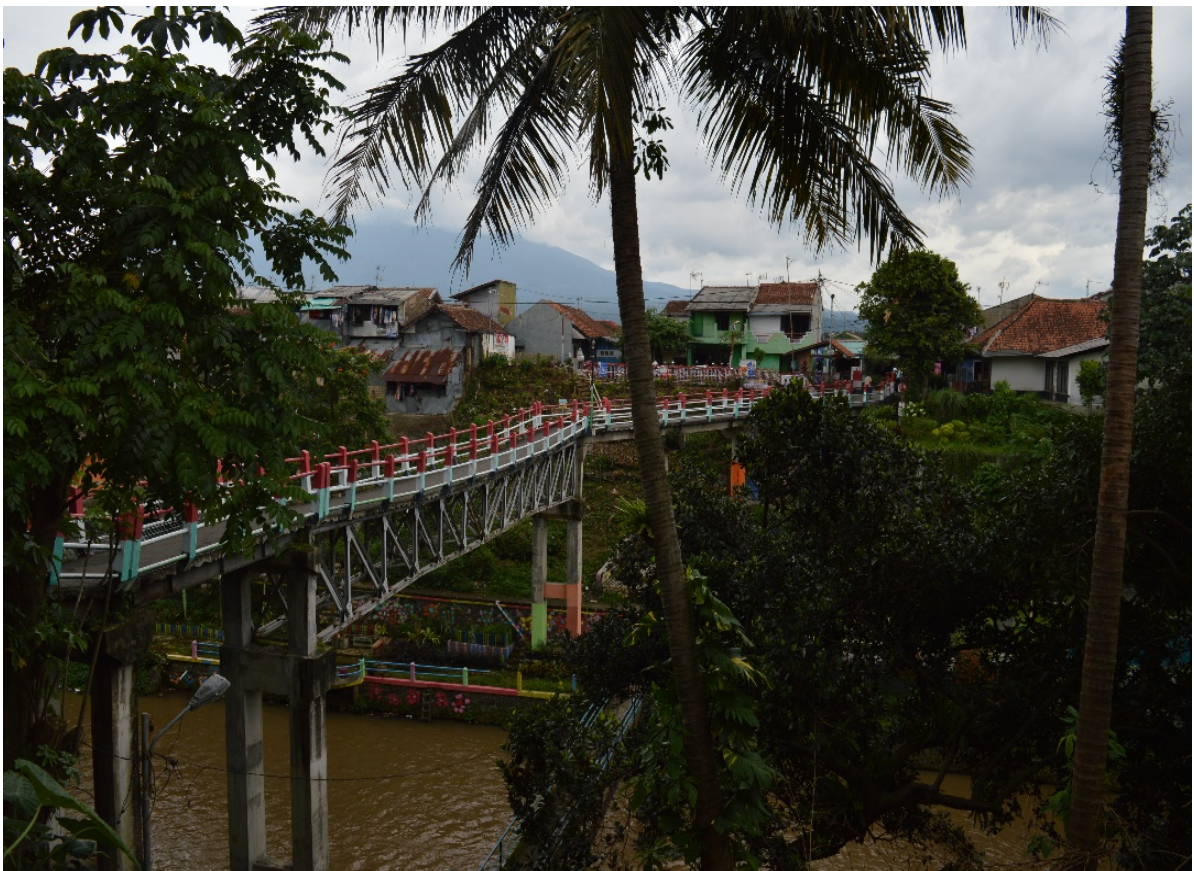
Couverture : Pont à Bogor, Banlieue de Jakarta (A. Goutaland, mars 2019)

Pour citer cet article : Goutaland A., 2020, « La démonstration d'une crédibilité politique par les infrastructures : l'Indonésie et le moment Jokowi », Urbanités , Dossier / Urbanités sud-est asiatiques, septembre 2020, en ligne .