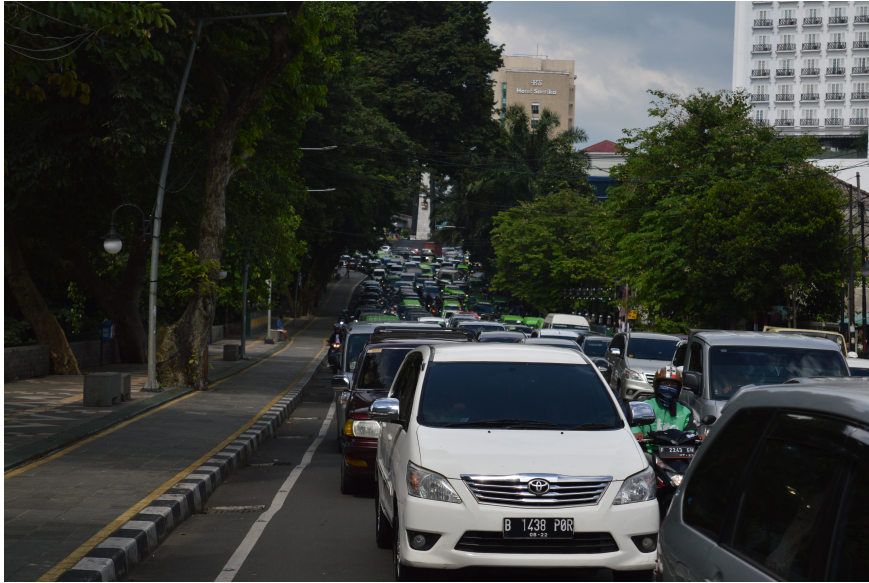
4. Embouteillage ininterrompu sur un grand boulevard de Bogor, Banlieue Sud de Jakarta (A. Goutaland, mars 2019)