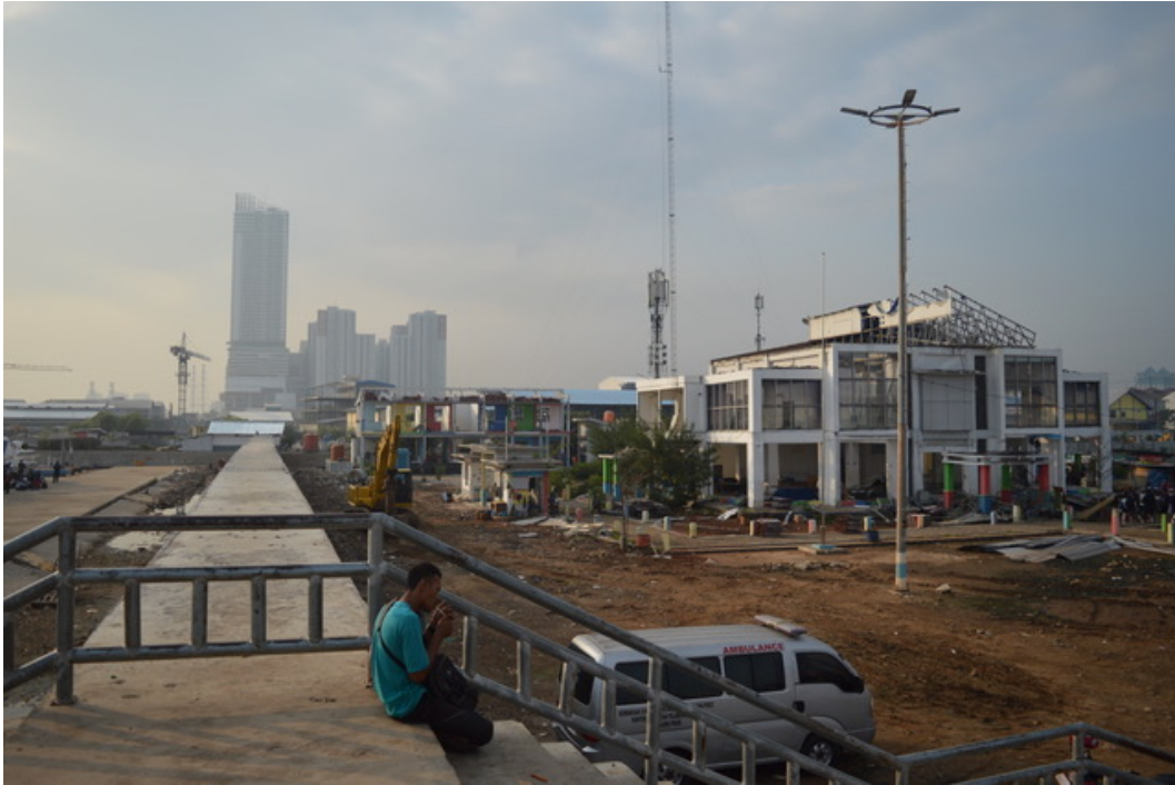
5. Un projet de développement urbain du front de mer et ses marges vus depuis le port de Kali Adem, Jakarta (A. Goutaland, mai 2019)

Toutefois, malgré cela, plusieurs éléments concrets fragilisent cette récente crédibilité. En effet, nous avons pu constater certaines malfaçons sur des portions d'autoroute neuves, et il semble qu'une évaluation générale de la qualité des routes, voies de chemin de fer et réseaux soit essentielle pour que l'ambitieuse politique menée serve les objectifs fixés. Au-delà de ces objectifs, le changement climatique pose la question du devenir incertain des nouvelles infrastructures dans un pays où les conséquences de ce changement climatique sont déjà visibles, comme les sols qui s'affaissent à Jakarta (Mei Lin et Hidayat, 2018). Ainsi, bien que le nouveau métro ait été conçu pour supporter des affaissements de terrain actuels de plusieurs centimètres par an, pourrait-il supporter une élévation de plusieurs mètres du niveau de la mer et des affaissements plus conséquents ? Sur ces points, les entretiens menés n'ont pas permis d'obtenir de réponses tranchées et ce sujet demeure une véritable épine dans le pied de la politique urbaine de Jokowi.