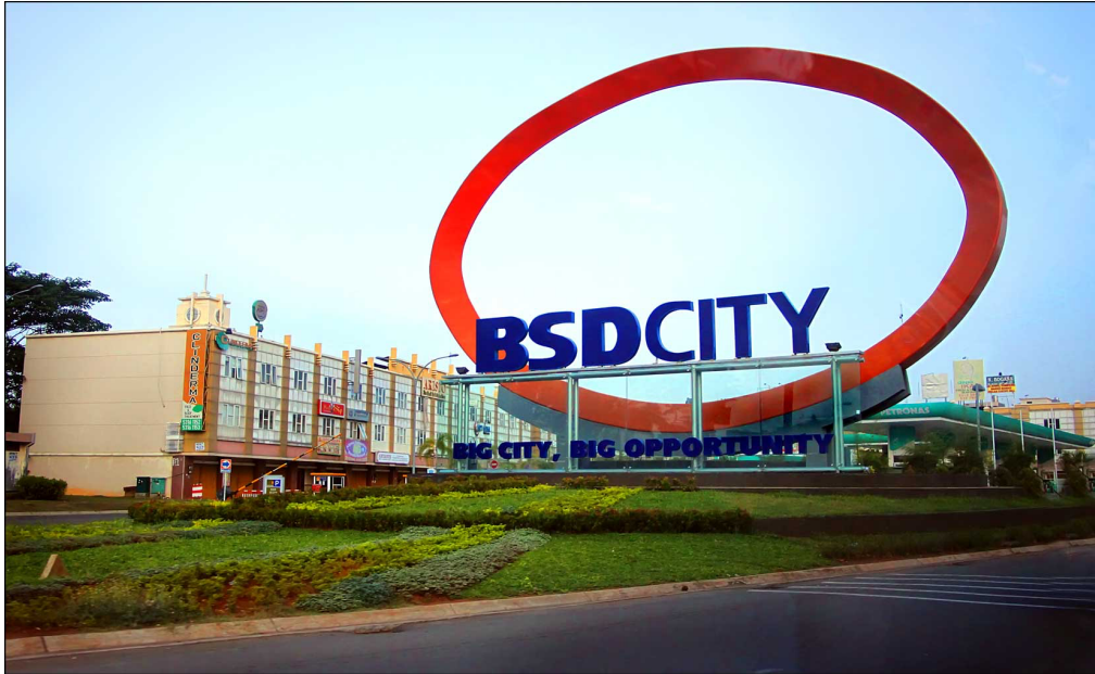
2. Entrée emblématique de BSD City (BSD City, Sinarmas Land, 2015)

Dans la lignée du succès de BSD City, Tangerang a vu l'établissement de deux autres nouvelles villes nouvelles en 1987 : Cikarang s'étalant sur 5 900 hectares et Tigoraksa sur 3 000 hectares (Silver, 2007). Des études récentes montrent que ces villes nouvelles ont participé à une gentrification des banlieues de Jakarta (Winarso et al. , 2015).