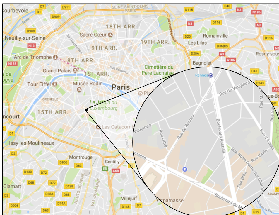
Figure 3 Cas d'étude : zone autour de la rue de Rennes

Le cas d'étude proposé est une zone autour de la rue de Rennes, à Paris. C'est à la fois un axe routier important et une rue avec de nombreux commerces. La zone étudiée est composée de 69 commerces et 14 aires de livraison.