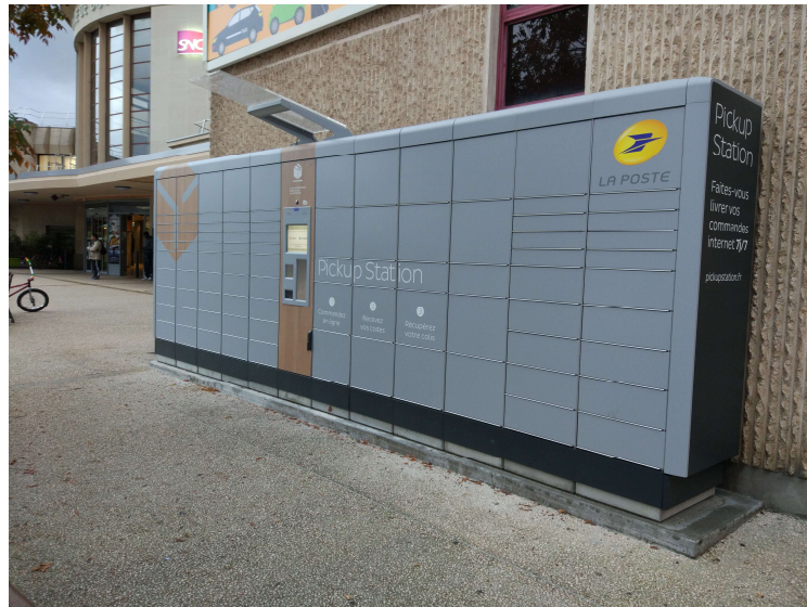
FIGURE 4 CONSIGNES SITUÉES EN GARE SNCF DE DIJON-VILLE

La consigne est une solution développée plus récemment, située dans des espaces publics (gares par exemple) ou dans des bureaux de poste. Le livreur dépose le colis dans un des casiers sécurisés et le particulier se déplace à la consigne pour aller chercher son colis. Très développée dans certains pays comme la Chine et la Pologne, la consigne se développe plus doucement en France. Pour des raisons de sécurité les consignes actuellement mises en place sont des modèles sécurisés encore extrêmement coûteux 53 et le choix des emplacements en extérieur est encore complexe.