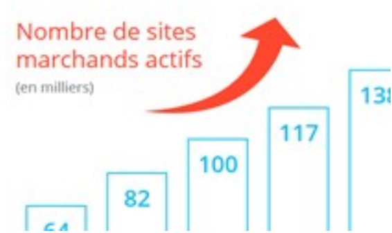
FIGURE 2 NOMBRE DE SITES MARCHANDS ACTIFS

Les consommateurs y trouvent leur compte puisque les e-commerçants offrent un choix de produits bien plus vaste et pratiquent des prix souvent moins élevés que les magasins physiques ne peuvent proposer, car ils n'ont ni frais de gestion de magasin, ni personnel de vente.