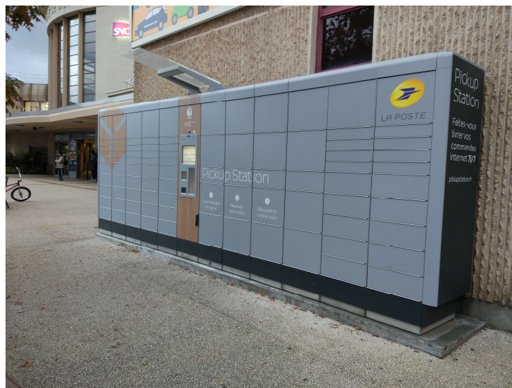
FIGURE 4 CONSIGNES SITUÉES EN GARE SNCF DE DIJON-VILLE

La consigne est une solution développée plus récemment, située dans des espaces publics (gares par exemple) ou dans des bureaux de poste. Le livreur dépose le colis dans un des casiers sécurisés et le particulier se déplace à la consigne pour aller chercher son colis. Très développée dans certains pays comme la Chine et la Pologne, la consigne se développe plus doucement en France. Pour des raisons de sécurité les consignes actuellement mises en place sont des modèles sécurisés encore extrêmement coûteux 53 et le choix des emplacements en extérieur est encore complexe.