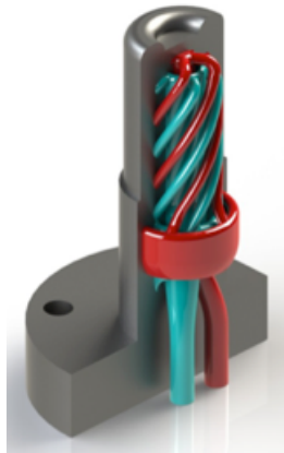
Moule à canaux de refroidissement conformes

position dans l'espace des canaux de refroidissement ( conformal cooling ) de moules pour l'injection de plastique. Tirant parti de la liberté de conception en trois dimensions, cette technique déjà assez répandue offre des gains de l'ordre de 30% à 40% 16 sur le temps de refroidissement de la pièce injectée.