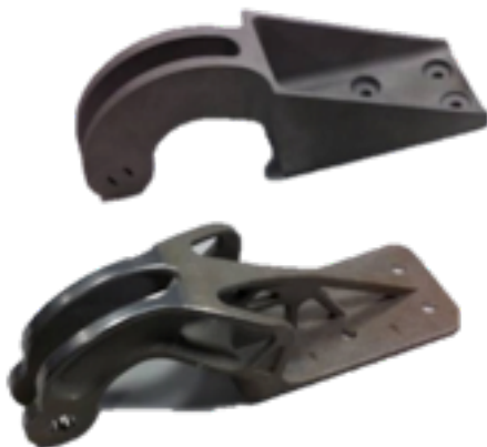
Charnière de porte d'A320, pièce classique (haut) et pièce produite par fabrication additive après optimisation topologique (bas)

La fabrication additive a le potentiel de se substituer à d'autres techniques pour la production d'un certain nombre de pièces à définir dans l'ensemble de pièces assemblées par un donneur d'ordre, dès lors que le gain réalisé le justifie, techniquement et économiquement. Une prise de conscience des donneurs d'ordres est donc nécessaire pour passer en revue leurs pièces et tester la pertinence de l'utilisation de la fabrication additive. Nos interlocuteurs ont souligné le fait qu'il était d'ores et déjà avantageux de produire certaines pièces par fabrication additive, et ce sans en changer le design. Il s'agit de cas rares, que des études technico-économiques sont chargées d'identifier 23 . Le principal enjeu réside cependant dans le gain potentiel associé à la reconception et à l'optimisation de pièces intégrant les possibilités de design avancées de la fabrication additive. C'est un point crucial, mais bien plus compliqué à prendre en compte, l'étude technico-économique nécessitant alors un investissement élevé. L'image suivante montre un exemple représentatif : une charnière d'A320 reconçue par un partenariat EADS/EOS/Multi-station, en utilisant une démarche dite d'optimisation topologique 24 . Un gain de masse d'environ 40% sur la pièce et un gain de matière de 75% ont été réalisés.