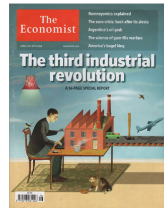
Une du magazine "The Economist" (Février 2011 et Avril 2012)

À l'instar du penseur américain Jeremy Rifkin 5 , de The Economist ou même de Barack Obama 6 , nombreux sont ceux qui en vantent les promesses révolutionnaires et le potentiel infini. Par sa diffusion notable auprès du grand public, d'une part, et par sa popularité dans les milieux technologiques d'autre part, l'impression 3D est devenue pour beaucoup porteuse d'un véritable rêve : celui d'une fabrication simple, à la demande, personnalisée, abstraite de toute contrainte logistique, qui ferait alors disparaître l'industrie manufacturière telle que nous la connaissons aujourd'hui. Chacun deviendrait producteur chez lui (ou à tout le moins près de chez lui) de ses propres biens, un producteur aux