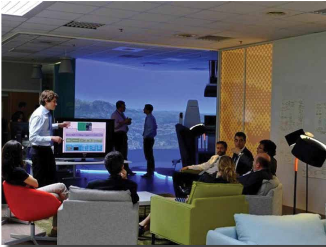
Figure 2: Innovation hub de Thales

d'innovation intensive a conduit à compléter les projets par des collectifs de conception innovante (ateliers, labs, communautés d'innovation) qui explorent l'inconnu plus radicalement 11 . Une part importante de la recherche en sciences de gestion étudie aujourd'hui ces nouveaux métabolismes et les collectifs qu'ils produisent.