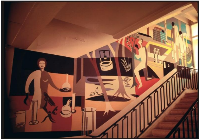
Figure 1 - peinture de l'escalier principal du bâtiment SPR, rez-de-chaussée, mur ouest. (De gauche à droite) Une technicienne prépare des échantillons dans un laboratoire. Un puits évoque les prélèvements d'échantillons d'eau. Un agent effectue des prélèvements sur un arbuste. Deux hommes recueillent de l'eau dans des récipients. A l'arrière-plan, Castan représente un bassin vide et le bâtiment G1. © CEA / J. Castan.

Comment représenter le métier de radioprotectionniste, traqueur de particules infimes et invisibles ? Un dessinateur du CEA Marcoule relève le défi en réalisant, en 1962, une peinture murale sur la protection contre les radiations. Un témoignage sur l'âge d'or du nucléaire.