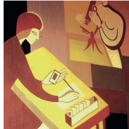
Figure 4 - détail de l'œuvre. Dès 1955, les agents de Marcoule reçoivent des films dosimètres. Au plan individuel, ils sont fondamentaux car ils déterminent les rythmes de travail et les contraintes opérationnelles pour limiter la contamination ou l'irradiation du personnel. Ces dosimètres passifs sont recouverts d'émulsions sensibles aux particules radioactives. Une fois développé, la mesure du noircissement indique les doses d'irradiation reçues par l'agent. Les films sont d'abord développés à Saclay, avant que le SPR ne mette en service son propre laboratoire de photométrie. A ses débuts, le SPR constate un taux élevé de films non rendus ou égarés. A partir d'août 1959, le chef de service note une amélioration sensible, qu'il attribue à l'efficacité des campagnes de sensibilisation. L'utilisation du film dosimètre met donc du temps à s'imposer auprès des travailleurs. Castan évoque justement les activités du laboratoire de photométrie dans la deuxième partie de sa peinture. Il fait ici du film un objet frontière entre le monde visible et invisible. Le détecteur est représenté comme une carte à jouer, divulguant des prédictions sanitaires que le SPR se charge d'interpréter. Dès lors, l'image pourrait-elle traduire une certaine ambiguïté, en associant photométrie et cartomancie ? Compte tenu du manque de recul à cette époque sur la performance des films, l'injonction du SPR à leur faire confiance réclame en effet une dose de croyance... © CEA / J. Castan.

Castan pose un regard tendre et poétique sur la radioprotection. Hélas, sa peinture murale n'est pas parvenue jusqu'à nous. La mauvaise qualité des enduits condamne l'œuvre avant même sa réalisation. Le dernier coup de pinceau est donné, deux ans s'écoulent et les murs s'effritent déjà. Le SPR