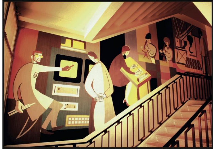
Figure 2 - peinture de l'escalier principal du bâtiment SPR, premier étage, mur est. (De gauche à droite) Un agent montre au chef de l'installation des données issues d'un tableau de contrôle des rayonnements. Une technicienne reporte le numéro d'un film dosimètre sur une liste nominale. Deux femmes regardent au microscope des films dosimètres. Un homme tient une babyline (appareil portatif permettant de mesurer le niveau d'irradiation), devant une zone d'entreposage de fûts de déchets radioactifs.

Quatre ans plus tard, Castan se lance dans un projet pictural ambitieux, lui permettant d'exprimer toute la mesure de son talent.