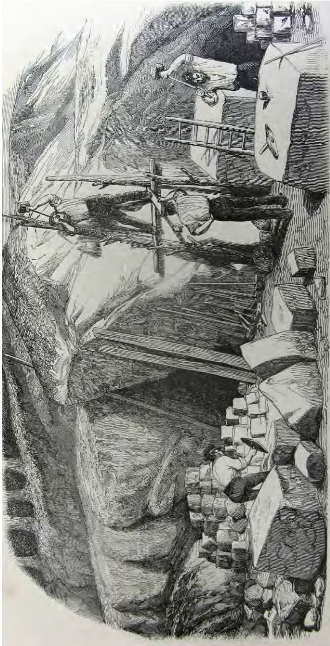
Grésière aux Rochers-Fourceau, extrait de L'Illustration, 17 octobre 1846.