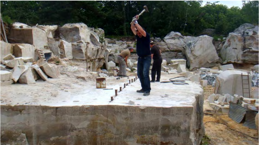
Abattage d'un bloc par la méthode des coins, carrière Établissements Les Grès de Fontainebleau & Cie, Moigny-sur-École.

L'exploitation du grès a atteint son apogée dans la première moitié du XIX e siècle avec la généralisation du pavage des rues. En 1846, 340 carriers étaient recensés en forêt de Fontainebleau, auxquels il faut adjoindre terrassiers, journaliers, compagnons, voituriers, forgerons ; le tout représentant environ 1 000 emplois dans les moments de forte commande. L'activité déclina avec l'avènement du chemin de fer qui permit des approvisionnements plus diversifiés et plus lointains.