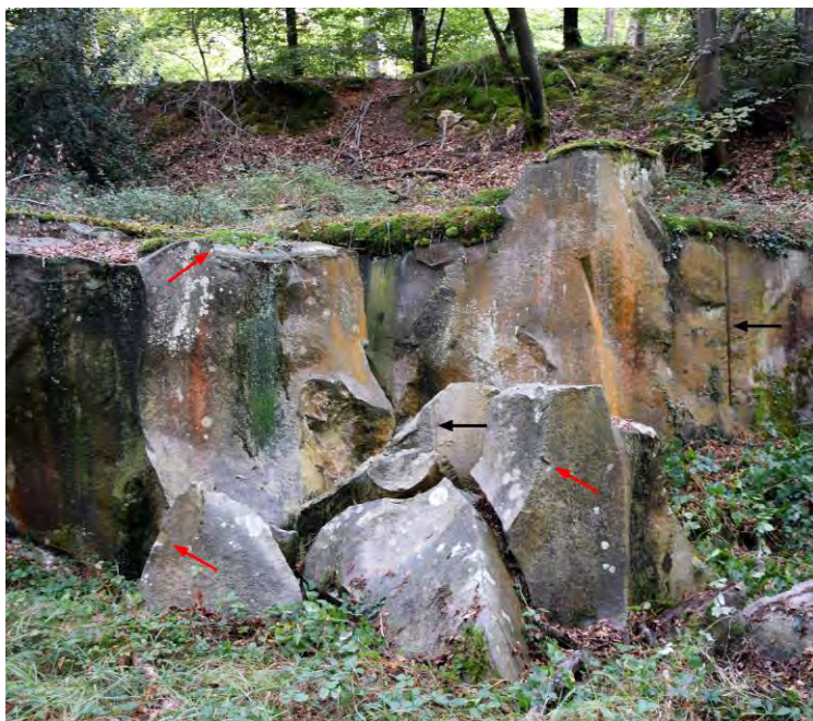
Front de taille avec traces de barre à mine (flèches noires) et traces de mortaise (flèches rouges).

La platière de grès du Rocher du Long Boyau est l'une des multiples platières exploitées au cours des siècles pour servir à la construction et au pavage des rues. Exploitée dans la seconde moitié du XIX e siècle, la carrière, ou plutôt les carrières, sont bien préservées et permettent d'expliquer les techniques utilisées et de décoder le paysage lors de l'exploitation.