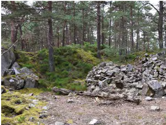
Champs d'écales (rebuts) à l'avant du front de taille.