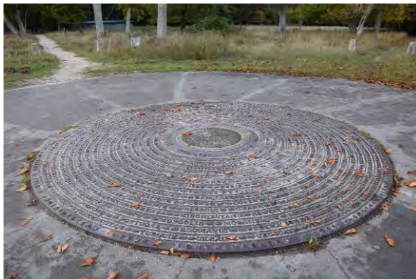
L'Oeil des Nations installé à Franchard en 1998 lors du 50 ème anniversaire de la création de l'UICN.

Les Réserves Biologiques Intégrales prolongent les Séries Artistiques créées en 1853 sous l'impulsion des peintres de Barbizon, Th. Rousseau et JF. Millet. Ces reliques de forêt naturelle, foisonnantes de vie, furent les premiers espaces au monde à recevoir un statut de protection. Depuis lors, Fontainebleau demeure un lieu emblématique de la protection de la nature, comme le réaffirmèrent en 1948 les États et membres fondateurs de l'Union Internationale de Conservation de la Nature (UICN) réunis à Fontainebleau.