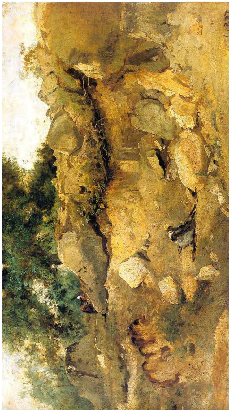
Carrière de la Chaise-Marie, Fontainebleau, Corot, 1831, Musée des Beaux-Arts de Gand La carrière se développe en excavation, avec soutènement de bois sous les blocs. Un homme est enseveli sous le bloc quadrangulaire et tend le bras, à droite une silhouette féminine (inachevée) déverse des déblais de sables blancs d'un baquet. Les glaneuses ramassent du bois pour faire un brancard. Instantané d'accident de chantier à la carrière de la Chaise-Marie !