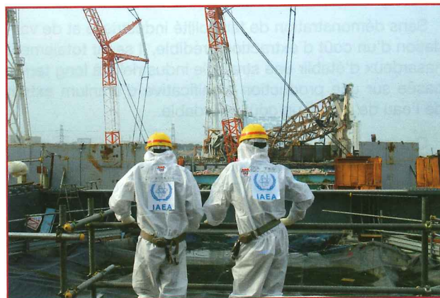
Une mission de revue de l'AIEA : les travaux en cours sur l'unité 4 de Fukushima Daiichi

Les séquences de défaillances de chacune des tranches n°1, 2 et 3 se sont déroulées de manière relativement indépendante mais, en raison de la transmission par les chefs de quart d'informations erronées ou lacunaires, la supervision d'ensemble par la cellule de crise sur site a été défaillante. L'ensemble des dommages dans les réacteurs qui n'ont pas été refroidis pendant plusieurs heures ont provoqué d'importants rejets radioactifs. La commission d'enquête japonaise a pointé les carences dans l'action