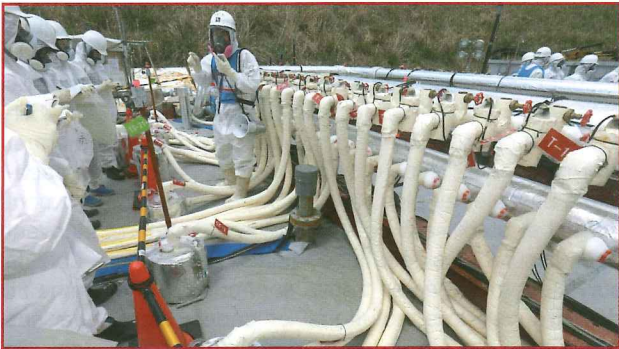
Mise en place du "mur de glace" pour ralentir l'accumulation d'eau contaminée dans le sous-sol de la centrale de Fukushima Daiichi

La situation sur le site de Fukushima-Daiichi a mis en évidence une nouvelle fonction potentielle de l'ingénierie. Un exemple topique est fourni par l'analyse des travaux menés pour décontaminer les volumes importants d'eau injectés dans les cuves des réacteurs pour leur refroidissement. En complément d'une sécurité encadrée par des normes, élaborées au stade premier de la conception, se dessine ainsi l'opportunité d'une ingénierie en situation d'urgence visant à contenir les risques d'un système sociotechnique tandis que certaines de ses fonctions essentielles ont été détruites ou sont menacées. Le défi est alors d'intégrer une dimension sociétale à l'activité pour ne pas la réduire à l'expression chiffrée d'une analyse essentiellement technicienne. Le changement temporaire d'organisation doit aussi offrir un cadre managérial permettant de faire émerger de nouveaux potentiels d'innovation dans un contexte d'urgence.