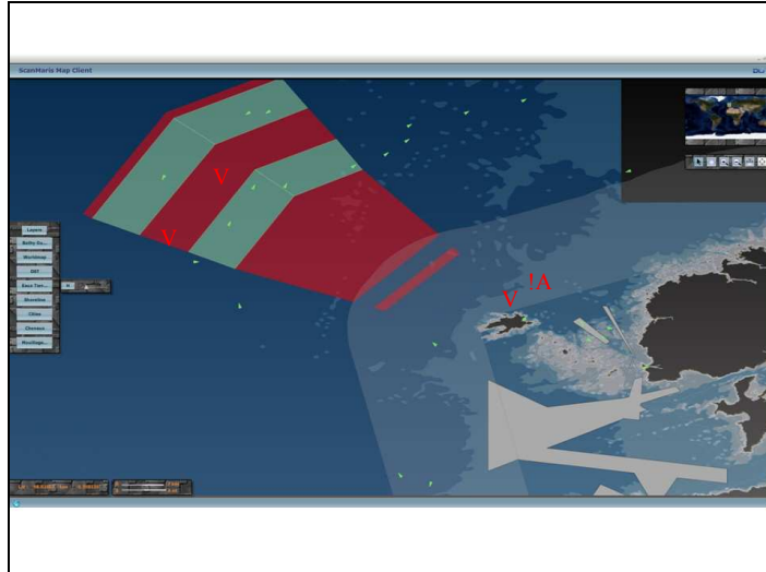
Figure 4 : Situation maritime renseignée et analysée, 17 octobre 2008