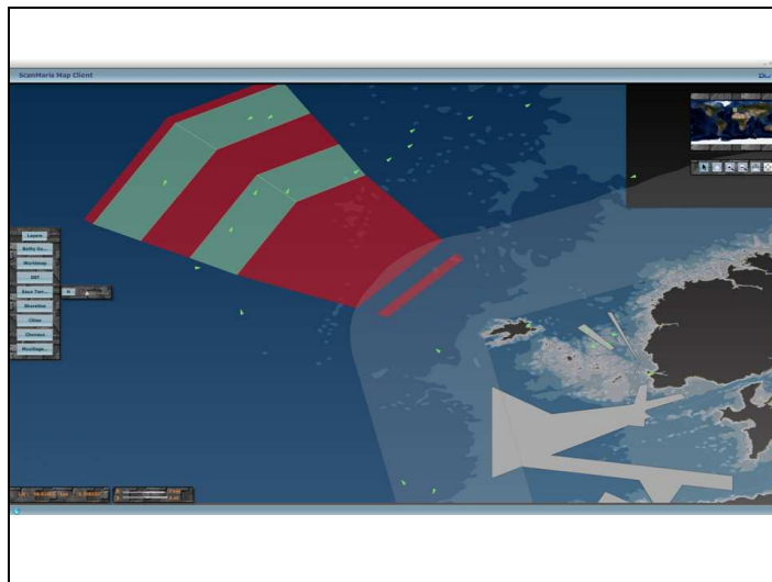
Figure 3 : Situation maritime du chenal de la Helle et du DST Ouessant, transcrite sur fond cartographique ENC, format S57.

La situation du 17 octobre 2008 à 12H est figurée ci dessous :