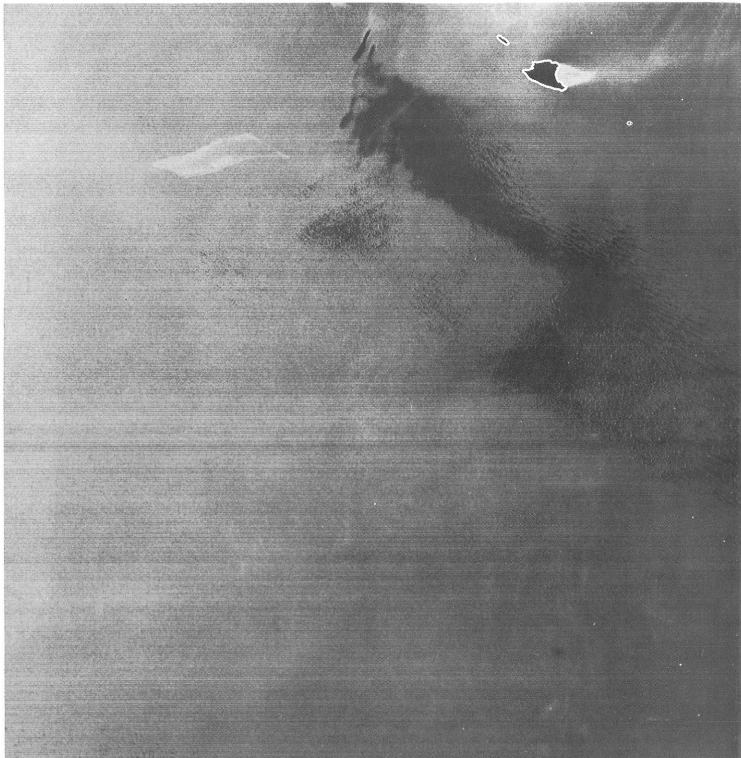
Fig. 2 : POLLUTION AU SUD DE LA CRETE (26 Juillet 1975)

Coordonnées du centre de l'image : N 34-30 et E 23-30. Une nappe d'huile est visible en haut à gauche. Il soufflait alors sur la région un vent d'Ouest, et on discerne nettement, à l'Est de l'île de Gavdhos (en haut à droite), une partie de mer sombre représentant une mer calme, abritée du vent par l'île.