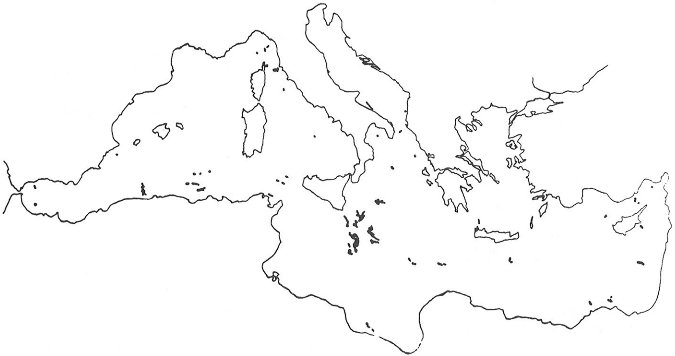
Fig. 4 : CARTOGRAPHIE DES FILMS D'HYDROCARBURES OBSERVES SUR LES IMAGES LANDSAT EN JUIN 1981

Afin de démontrer l'efficacité de la méthode de dépouillement assistée par ordinateur des images LANDSAT, mise au point au CTAMN pour les problèmes de pollution, nous avons procédé à un nouvel inventaire, concernant le mois de Juin 1981 essentiellement. Cet inventaire est représenté sous forme de carte (Fig. 4) où les nappes d'huile sont en trait épais.